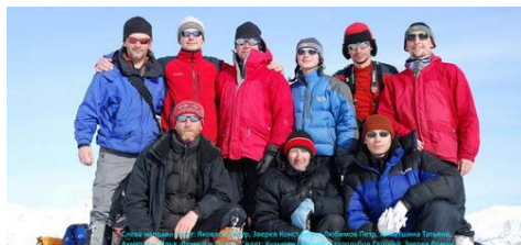
Групповой снимок участников экспедиции 2011 года